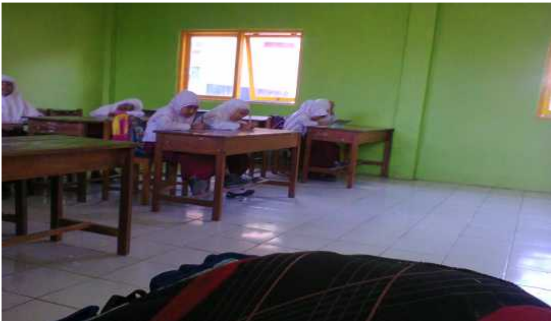
Tes Kemampuan Membaca Pemahaman