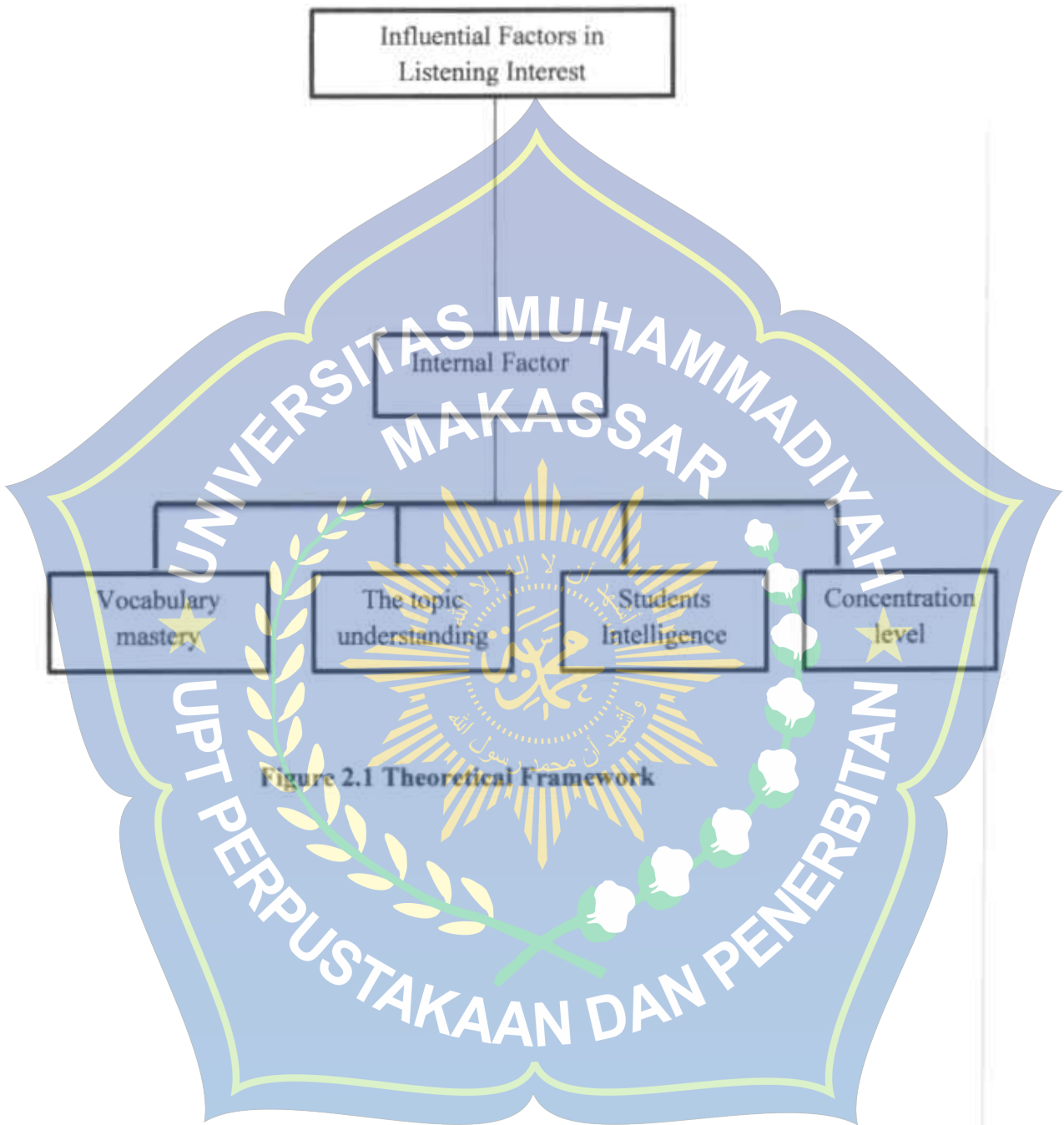
Figure 2.1 Theoretical Framework