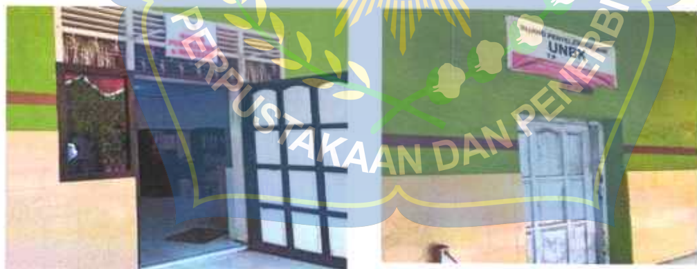
PERPUSTAKAAN DAN PENERBITAN