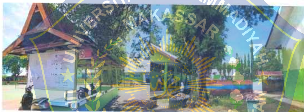
Ruangan Kepala Sekolah