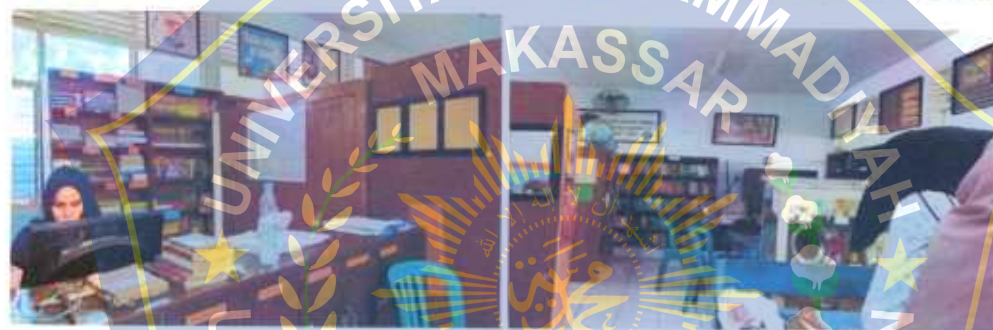
Ruang Pengajaran &amp; Wakasek