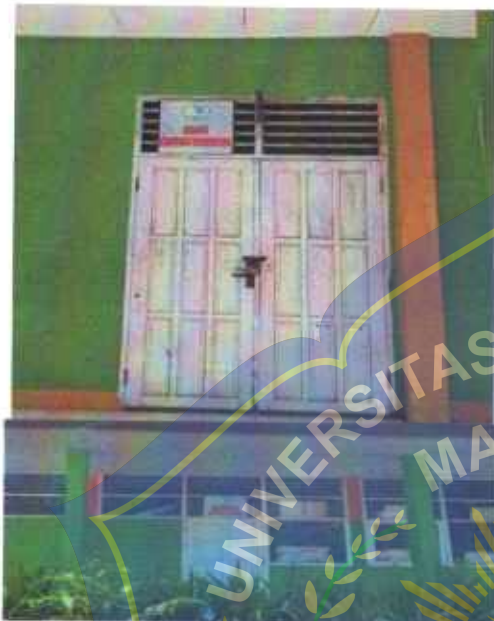
Ruangan Laboratorium IPA & Kesenian