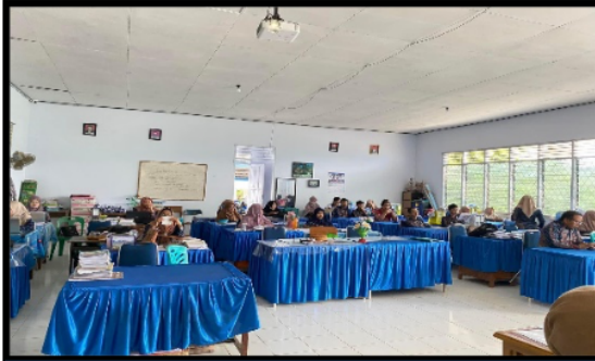
Gambar 3. Proses Materi Ketiga tentang penggunaan bahasa pada penulisan jurnal

Proses pelaksanaan materi ketiga terkait penggunaan bahasa pada penulisan jurnal, materi lebih diarahkan pada pola penulisan sederhana. Seperti cara membuat suatu paragraf dalam penulisan jurnal ilmiah harus memiliki kejelasan apa yang akan ditulis dengan memperhatikan gagasan utamanya, maka penempatan induktif atau deduktif harus jelas. Secara teoritik penulisan paragraf