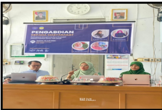
Gambar 2. Proses Materi Kedua tentang pemilihan bahan pustaka dalam penulisan

dalam Rencana Pelaksanaan Pembelajaran (RPP). Arahkan pemateri bertujuan untuk mensingronisasikan antar artikel yang dibuat sesuai dengan bidang kompotensi sehingga lahir relevasin antara artikel yang dihasilkan dengan materi pembelajaran yang dibawakan.