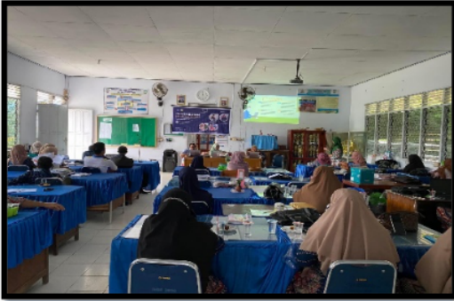
Gambar1. Proses Materi Pertama tentang teknik penulisan karya tulis ilmiah.

Proses kegiatan PKM dilakukan setelah proses administrasi semua peserta terlaksana. Muatan materi yang dibawa pada kegiatan awal pertemuan yaitu teknik penulisan karya tulis ilmiah. Isi dari materi tersebut terkatikati perumusan judul, abstrak dan konteng dalam setiap bagian pada artekil atau jurnal. Penyusunan artikel atau jurnal agar guru lebih mudah menentukan konten judul dan sub poain dalam jurnal lebih diarahkan pada kurikulum pembelajaran yang tertuang