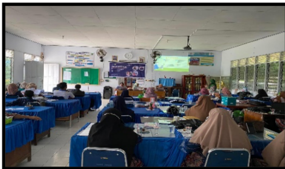
Gambar 4. Proses Materi Keempat tentang materi pemilihan jurnal dan cara publikasi

pada jurnal yang baik menurut Lidwina, S. (2013) dan Setyaningsih, Y. (2016) perlu memperhatikan metodologi penulisan paragraf dengan memperhatikan kesatuan, kepaduan dan kekompakan dan pengembangan paragraf serta memahami jenis paragraf yang baik.