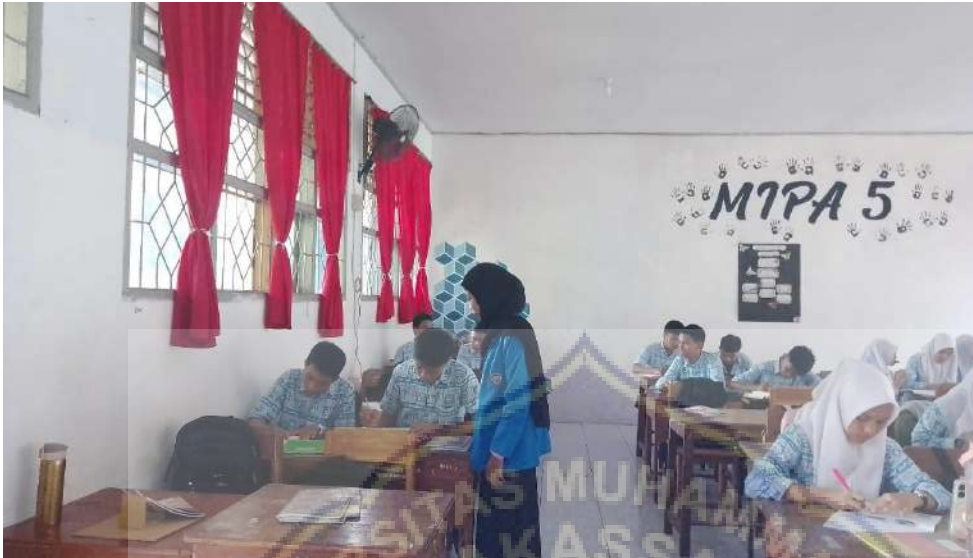
Siswa mengisi angket full day school dan karakter