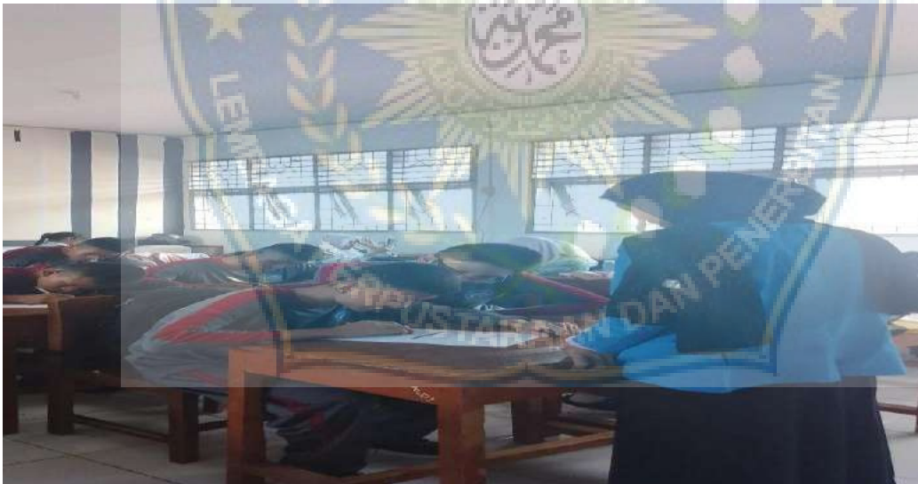
Siswa mengisi angket full day school dan karakter