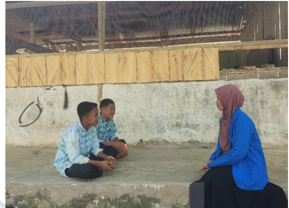
Dokumentasi 9: wawancara dengan peserta didik kelas VIII MTs