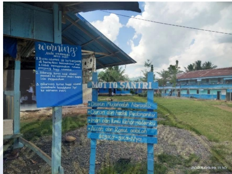
Dokumentasi 1: situasi di MTs Husnayain Salulebbo