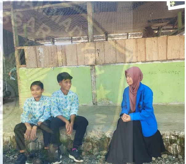
Dokumentasi 10: wawancara dengan peserta didik kelas VII MTs