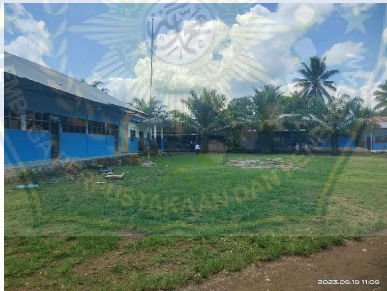
Dokumentasi 2: keadaan lingkungan kelas di MTs Husnayain Salulebbo