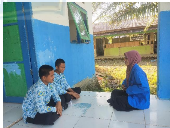
Dokumentasi 8: wawancara dengan peserta didik kelas IX MTs