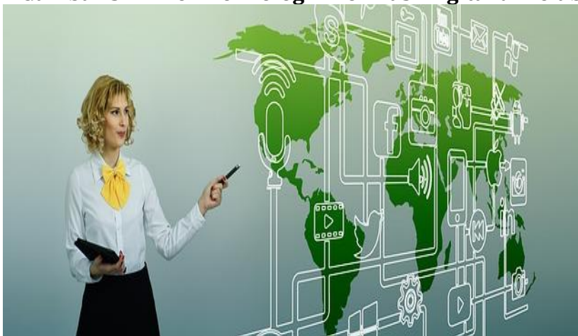
Gambar 3. 4 Tren Teknologi Informasi Digital di Pelabuhan

Teknologi informasi digital terus dikembangkan untuk mengoptimalkan distribusi barang di pelabuhan. Teknologi informasi digital terkini menjadi kunci utama untuk efektivitas dan efisiensi ditengah tingginya perdagangan antar negara.