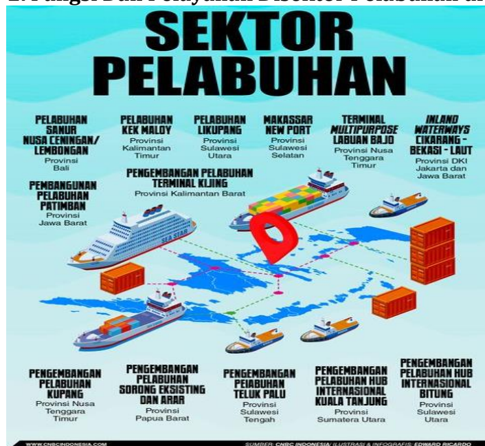
Gambar 2. Fungsi Dan Pelayanan Disektor Pelabuhan di Indonesia

Keharusan mengintegrasikan tiga subsistem (penyelenggaraan, perusahaan, dan