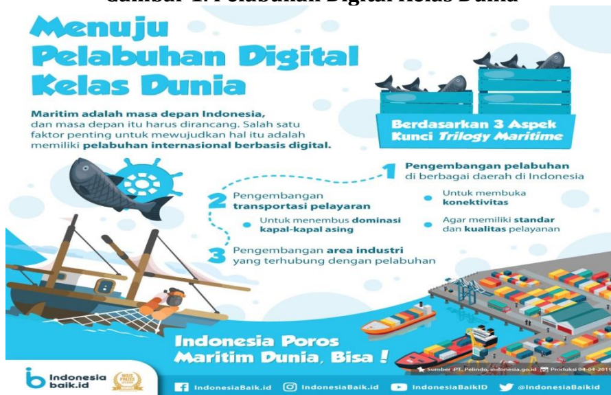
Gambar 1. Pelabuhan Digital Kelas Dunia

Adapun Pelabuhan Digital Kelas Dunia dapat dilihat dalam gambar di bawah ini 4 :