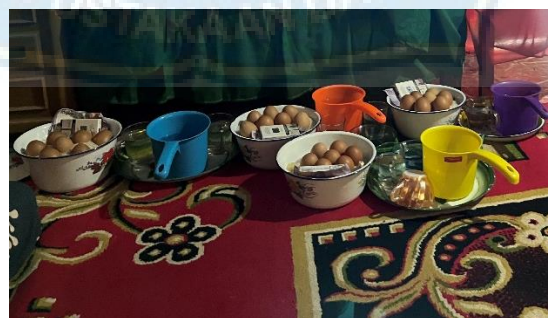
Gambar 5: Imbalan yang pasien bawa setelah sembuh dari penyakitnya.