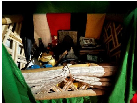
Gambar 3: Ranjang kecil berwarna hijau.