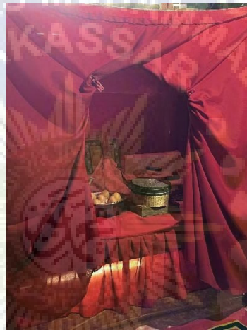
Gambar 4: Ranjang kecil berwarna merah.