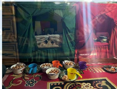
Gambar 2: Ruangan yang digunakan mengobati dan memiliki ranjang kecil.