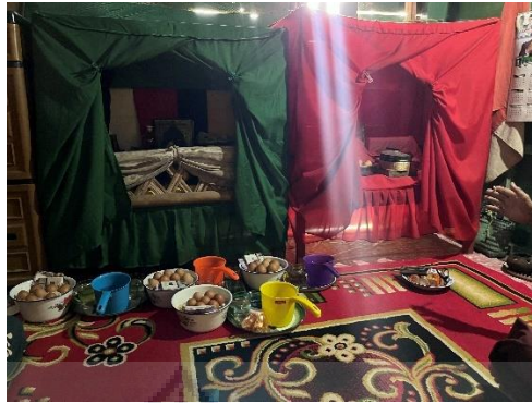
Ruangan Tempat Pengobatan Dilakukan