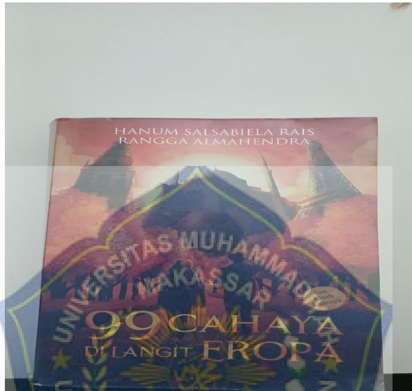
Lampiran II Sampul Novel