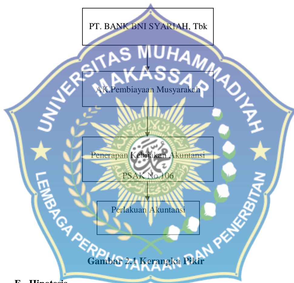
Gambar 2.1 Kerangka Pikir