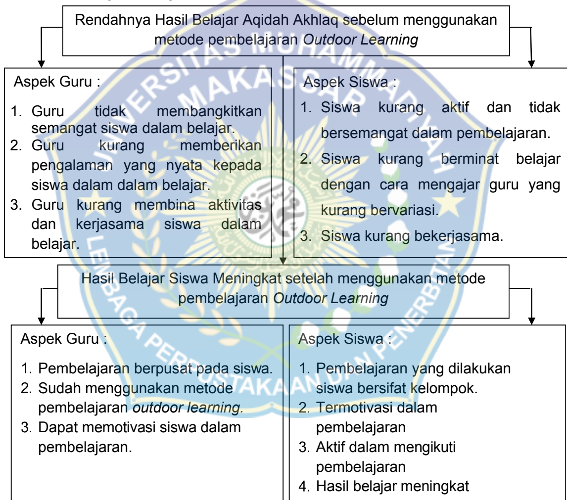
Bagan 1.1 Kerangka Pikir Sebelum dan Sesudah menggunakan Metode Pembelajaran Outdoor Learning

psikomotorik siswa dapat berkembang. Jika siswa berada dalam lingkungan pembelajaran yang kondusif serta suasana pembelajaran menyenangkan diharapkan siswa lebih mudah memahami materi yang diajarkan, sehingga hasil belajar kognitif siswa dapat lebih baik lagi. Untuk lebih jelasnya, maka disusunlah kerangka pikir yang disajikan dalam bentuk bagan sebagai berikut :