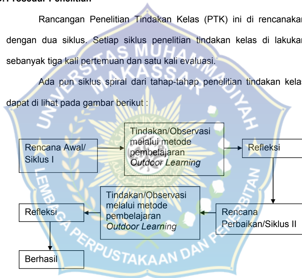
Bagan 1.2 Skema/bagan siklus dalam PTK 24

Ada pun siklus spiral dari tahap-tahap penelitian tindakan kelas dapat di lihat pada gambar berikut :