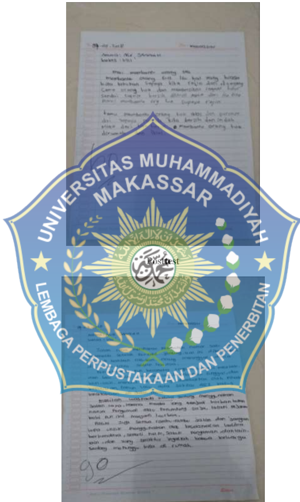
lampiran 20. Dokumentasi