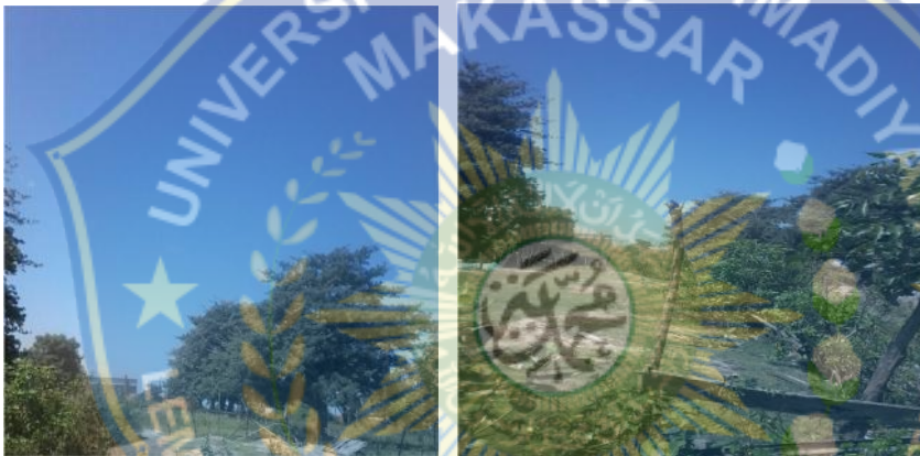
Kondisi lahan disekitar kawasan Industri