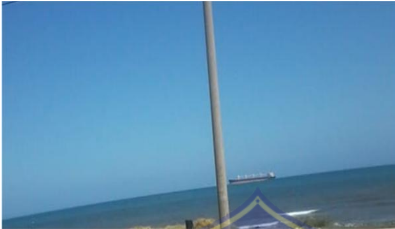
Kapal Pembawa nikel