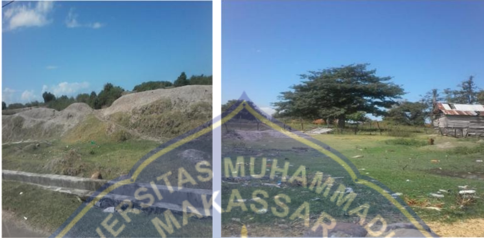
Kondisi tanah di Desa Papanloe