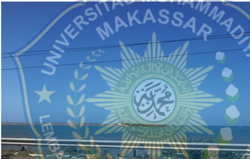
Tempat penyimpanan nikel yang baru datang/yang m