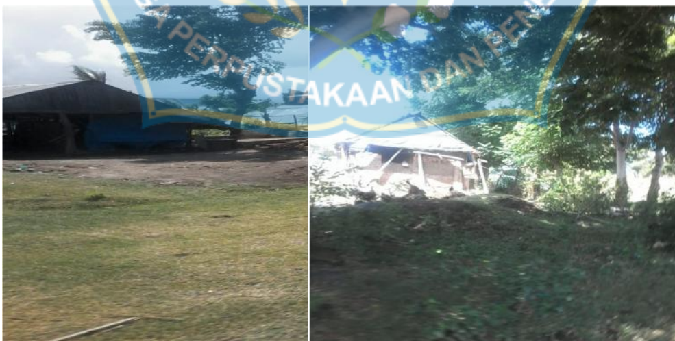
Tempat Industri Batu Bata Penududuk di Desa Papanloe