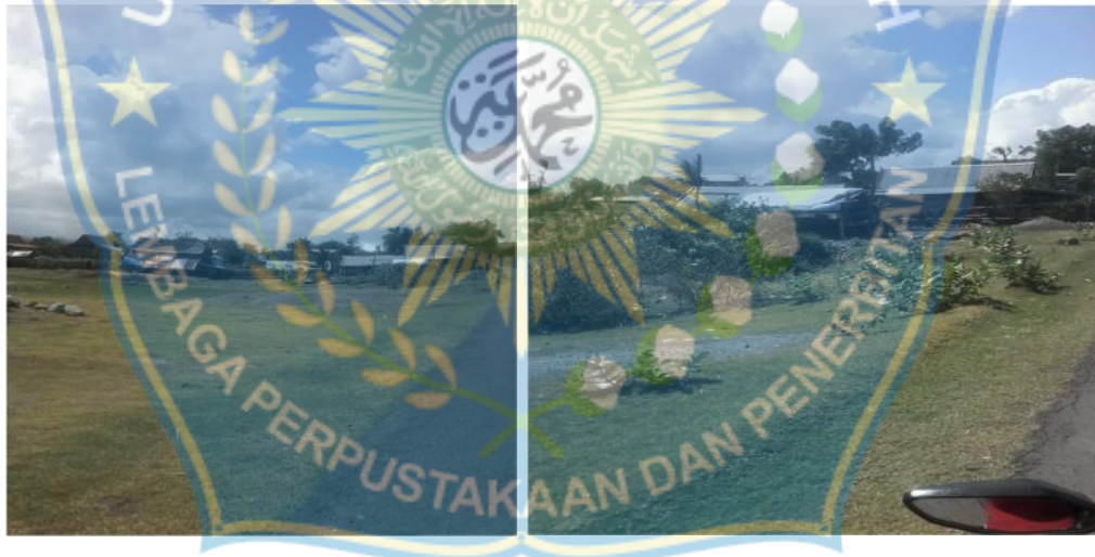
Kondisi rumah di Desa papanloe