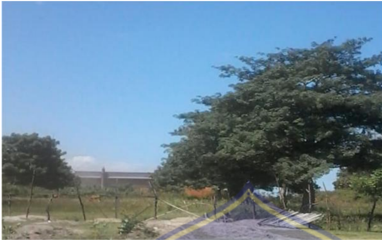
Kawasan Industri di belakang rumah penduduk