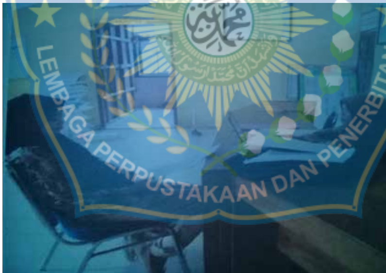
2. Wawancara Dengan Anggota Koperasi Unit Desa