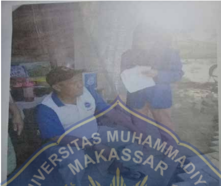
Gambar 3. Wawancara Dengan Anggota Penyuluh