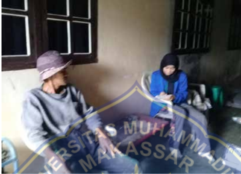
Gambar 1. Wawancara Dengan Anggota Kelompok Tani Segar Palawian