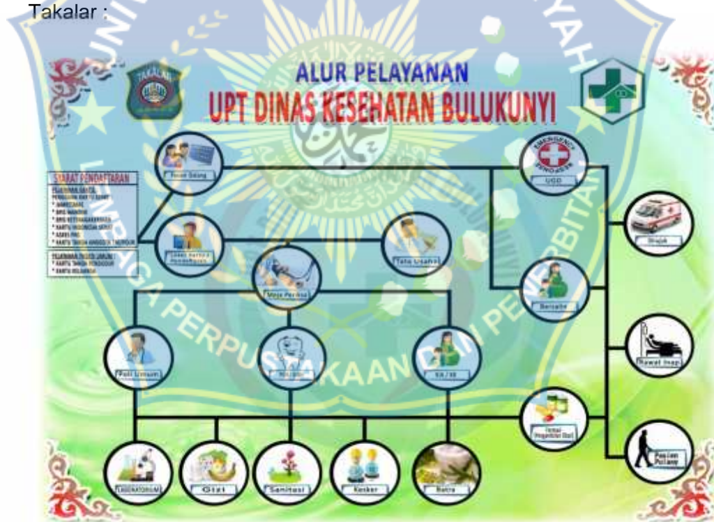
Gambar 2.1 Alur Pelayanan

Adapun alur pelayanan yang ada di Puskesmas Bulukunyi Kabupaten Takalar :