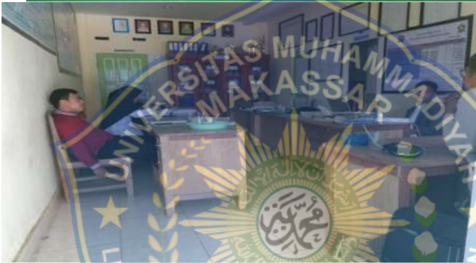
٥) كتاب الدراسة